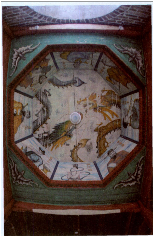
图七 步月桥内部藻井

今天，步月桥的交通要道功能还十分突出，每天数百余人要过桥，有很强的实用性。另一方面，步月桥仍是当地村民的休闲娱乐和民间活动的重要场所。每逢初一、十五，村里的善男信女们都会到那里烧香祭拜。每年农历八月十五中秋节这天，玉溪村民都会不约而同到步月桥送、摘灯笼。灯笼分红、白两色，红色的象征吉祥生财，白色的象征平安添丁。摘取灯笼者，不论红白，必须在次年中秋节“以一还六”，把灯笼送挂到步月桥，这已形成传统习俗，并几百年延绵不断。中秋节这天，村里的老太太们穿着蓝布衫聚会于此，她们有的敲打着乐器，有的双手捧着自制的步月桥模型，有的手持香烛，唱着特有的曲调。她们时而围成半圆形，时而排成一字形走桥，从廊桥的中间进去、出来，再往桥两头缓缓而行。中秋夜，月光洒满山村，男女老少欢歌笑语，云集于桥边，月光与灯笼烛光交相辉映。村民们还在桥边大放烟花爆竹，呈现出一幅