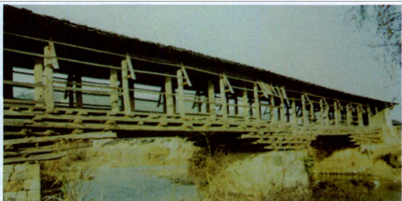
图三 修复前的步月桥跨河局部