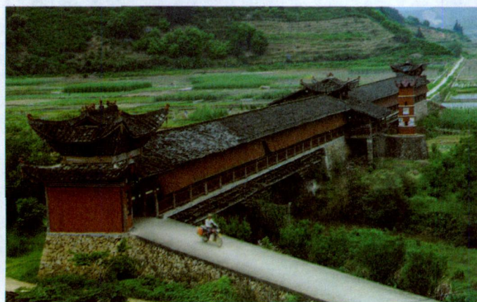
图四 修复后的步月桥的全景